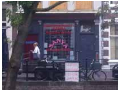
Sanya Wellnes Oudegracht 72