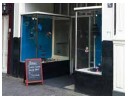
Cacao Oudegracht 179