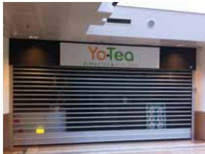
Bubble Tea HC