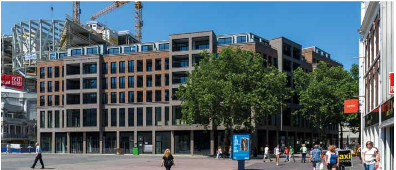
Het gebouw De Vredenburg is aan de buitenkant al bijna helemaal klaar. De binnenkant wordt de komende tijd helemaal ingericht. De eerste bewoners wonen er al. Later dit jaar gaan de eerste nieuwe winkels en de openbare fietsenstalling in de kelder van het gebouw open.

Het graafwerk kan tot enige hinder leiden voor bewoners, winkeliers en winkelend publiek. De aannemers proberen dit zoveel mogelijk te voorkomen. Er wordt over het algemeen doordeweeks en overdag gewerkt. Alleen als het echt nodig is kan er ook 's avonds, 's nachts en op zondag doorgewerkt worden. Hierover worden bewoners en winkeliers dan van te voren geïnformeerd.